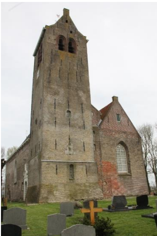
Foto Alexanderkerk, Rinsumageast. De verkeersweg oversteken naar 24 . Aan de linkerkant verderop, west van de rij wilgen, lag het in 1580 gesloopte klooster Claerkamp ( bouw 1165 ), waar in de hoogtij dagen meer dan 700 monniken verbleven en het van groot aanzien was in het noorden. De zinsnede " monniken hebben Friesland en Groningen op de kaart gezet " zou best een goede analyse kunnen zijn. Een prachtig vervolg van 25 en 30 naar Dokkum voert u langs de kronkelende Dokkumer Ee, een oud, toenmalig, getijde water tussen Lauwersmeer / Waddenzee en Leeuwarden.

Foto: De Wâl, Feanwâldsterwâl. Behalve deze fietsroute kunt u vanuit hier kanotochten maken in het prachtige natuurgebied Bûtenfjild . Bij 58 moet u even een uitstapje maken richting 35 om in het centrum museum De Schierstins ( uithof schiere monniken ) te bezoeken. Vanaf 58 weer verder het natuurgebied Bûtenfjild in via 57, 55, 54, 52 , naar Rinsumageast 53 . Door het centrum alhier stroomde vroeger het riviertje de Murk naar Dokkum. Het grote pand was ooit gemeentehuis en rechthuis. Ga in het centrum vooral even naar links ( west ) naar de Alexander kerk ( 12 e eeuw, twee-beukig ).