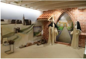
Foto: De inrichting in Observeum over kerk, klooster en monnik. Vanaf de kruising 54 volgt u de fietsknooppunten naar 81 via de Kloosterlaan. Rechts van u, ten noorden van de kerk, bevond zich ooit het klooster. Door het Friese landschap gaat via Quatrebras en een klein stukje richting Hurdegaryp naar 68 en het oude buurtschap Feanwâldsterwâl.

Foto: Observeum. U start deze noordelijke route vanaf Observeum, waarbij we zo nu en dan de historische paden gebruiken van de ( schiere ) monniken naar Dokkum. Onderweg staan we stil bij kerken en voormalige kloosters, maar ook bij de armenhuizen in diverse plaatsen. Kortom Charité ( naastenliefde, liefdadigheid, liefderijkheid; barmhartigheid ) van weleer in een arme Friese plattelandstreek. Vanaf het parkeerterrein steekt u over naar de Kerklaan, v.h. De Lykwei. Het behoeft geen betoog dat deze voert naar de begraafplaats verderop. Aan het eind van dit klinkerpad gaat u rechtsaf langs de Kruiskerk (Sint Maarten, 12 e eeuw) . In vroeger dagen was daar, tot afbraak en afbranden in 1581, een groot klooster ( Bergklooster ).