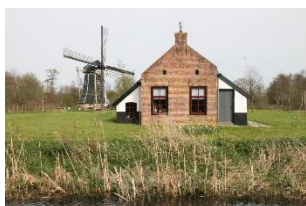
Foto: Openluchtmuseum de Sûkerei, Damwald met "boerespultsje" De Geast en molen De Mearmin. Door Broeksterwâld, 83 en 59 , weer door naar het Bûtenfjild via een oud pad de Goddeleazesingel 60 en 67 langs moerasachtig natuurgebied De Houtwiel (wiel is watergebied). Na 67 naar Noardburgum 05 en eventueel eindpunt 81 . Maar kies hier bij de rotonde beslist eerst voor de route langs de Rijksweg tot de volgende kruising

Trek in een kopje (arme lui surrogaat) chicorei koffie?