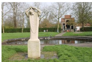
Foto: 754 Bonifatius bij Dokkum vermoord. Daarachter de bron en kapel. En dan na al dat moois, door naar de beeltenis van Bonifatius, de bron en de kapel iets buiten het centrum, vervolgens 63 en 65 . Onderweg passeert u museumpark De Sûkerei Damwâld met drogerij, herbouwde woningen, molen en meer uit het verleden van deze omgeving De Wâlden ( dorpsnamen voorheen alle met uitgangen "-woude" ).

Trek in een kopje (arme lui surrogaat) chicorei koffie?