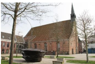
Foto de Grote kerk en de Ijsfontein

Voor u Dokkum via 01 en 63 weer uitfietst is er eerst nog genoeg te zien in het oude centrum van deze meest noordelijke Elfstedenstad.