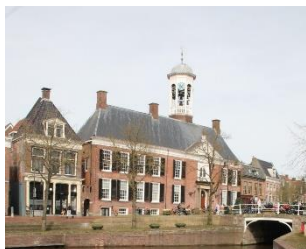
Foto: Het Stadhuis en op het keerpunt de Elfstedenschaats.