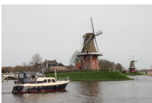
Foto De molens op het Bolwerk. Zoals: de Ijsfontein ( Eleven Fountains ) bij de Grote kerk ( Sint Martinus kerk, 1590 ), de katholieke kerk ( Sint Bonifatius kerk, 1871 ), het Museum / Admiraalshuis / Armenhuis, het stadhuis met keerpunt Elfstedentocht ( zie schaats ), de molens op het Bolwerk, de Waag en andere panden en grachten.