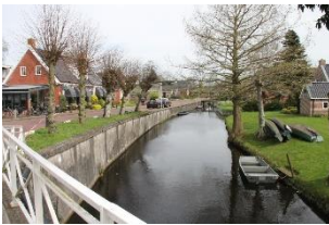
Foto: De Wâl, Feanwâldsterwâl. Behalve deze fietsroute kunt u vanuit hier kanotochten maken in het prachtige natuurgebied Bûtenfjild . Bij 58 moet u even een uitstapje maken richting 35 om in het centrum museum De Schierstins ( uithof schiere monniken ) te bezoeken. Vanaf 58 weer verder het natuurgebied Bûtenfjild in via 57, 55, 54, 52 , naar Rinsumageast 53 . Door het centrum alhier stroomde vroeger het riviertje de Murk naar Dokkum. Het grote pand was ooit gemeentehuis en rechthuis. Ga in het centrum vooral even naar links ( west ) naar de Alexander kerk ( 12 e eeuw, twee-beukig ).

Foto: De inrichting in Observeum over kerk, klooster en monnik. Vanaf de kruising 54 volgt u de fietsknooppunten naar 81 via de Kloosterlaan. Rechts van u, ten noorden van de kerk, bevond zich ooit het klooster. Door het Friese landschap gaat via Quatrebras en een klein stukje richting Hurdegaryp naar 68 en het oude buurtschap Feanwâldsterwâl.